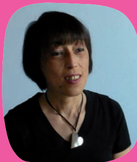
Manila 马尼拉 38岁

妇女在经过医生的测试，被认为合格后。捐赠脐带血你必须拥有良好的健康状态，以尽量减少把疾病传染给受赠人的危险性，至于血液的捐赠，存在临床条件和手术实施的风险时，需要阻止实行。在分娩时期接受外界输血的妇女，在捐赠6个月之后，为了防止排除存在传染病传播的可能性，需要重新进行复查。